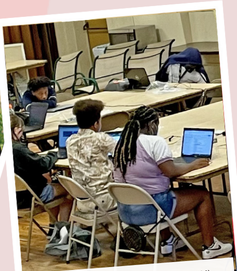
Ministerios Unidos del Área de Troya (TAUM) Tecnología para adolescentes