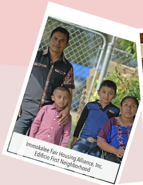
Immokalee Fair Housing Alliance, Inc. Edificio First Neighborhood