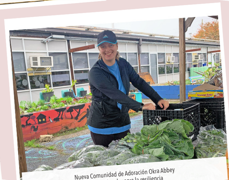
Nueva Comunidad de Adoración Okra Abbey La energía solar para la resiliencia