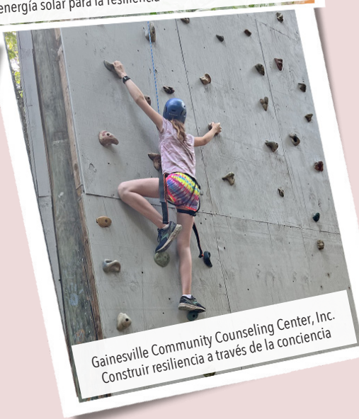
Gainesville Community Counseling Center, Inc. Construir resiliencia a través de la conciencia