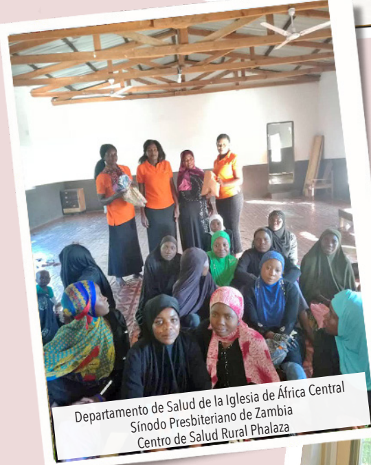
Departamento de Salud de la Iglesia de África Central Sínodo Presbiteriano de Zambia Centro de Salud Rural Phalaza