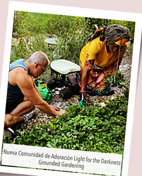
Nueva Comunidad de Adoración Light for the Darkness Grounded Gardening