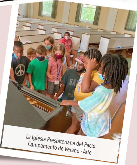
La Iglesia Presbiteriana del Pacto Campamento de Verano - Arte